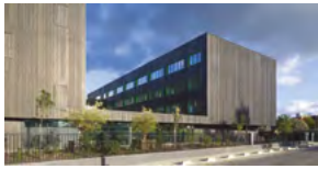
2022, Toulouse (31), siège régional de RTE.