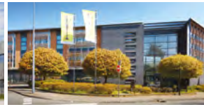
2018, Villeneuve d'Ascq (59), loué par EDF.

Les investissements passés ne préjugent pas des investissements futurs.