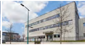
2021, Gennevilliers (92), siège social d'Audika.