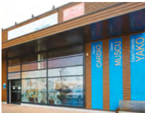
2015, rue Louis Aragon - Wittenheim (68), loué par une enseigne de fitness.