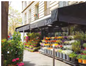
2018, place Charles Michels - Paris 15e, loué par un fleuriste.