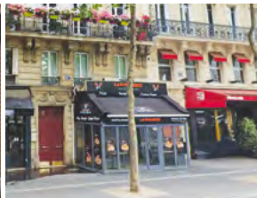
2014, bd Henri IV - Paris 4e, loué par un commerce de bouche.

Les investissements passés ne préjugent pas des investissements futurs.