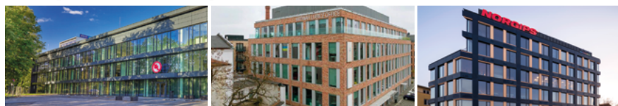
Actif acquis en 2023, situé à Varsovie, loué par UL International Actif acquis en 2022, situé à Cracovie, multi-locataires Actif acquis en 2021, situé à Varsovie, multi-locataires

Les investissements passés ne préjugent pas des investissements futurs.